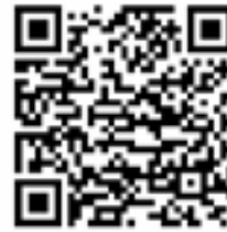
Mi Sphere Android

יש לחפש את היישומון "Mi Sphere Camera" חנות היישומים או לסרוק קוד QR זה כדי להוריד את היישומון. יש לסרוק את קוד ה-QR להורדה