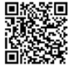
Mi Sphere iOS